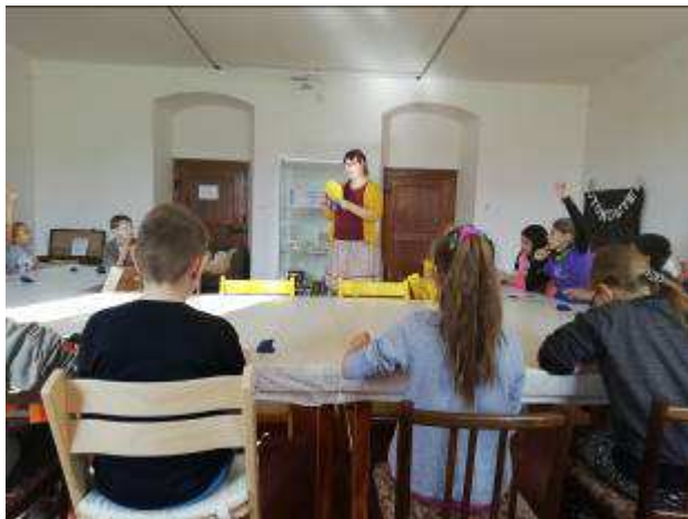
Obrázek 8 Edukační program Hrátky s barvami realizovaný v Muzejní dílně, jejíž vybavení bylo podpořeno finančním grantem společnosti Škoda Auto a.s.

V roce 2019 získalo Muzeum a galerie Orlických hor v Rychnově nad Kněžnou také finanční podporu od společnosti Auto Škoda a. s. V rámci projektu „Muzejní dílna – otevřený prostor pro děti bez rozdílů“ mohl být díky získané částce nakoupen vhodný nábytek (rostoucí židle, skládací pevné stoly) a hravé prvky do Muzejní dílny nacházející se v 2. patře Kolowratského zámku v Rychnově nad Kněžnou.