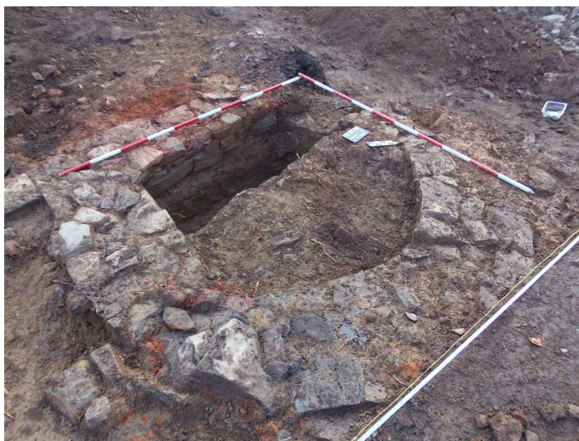
Obrázek 1 - Pozůstatky kamenného zdiva a studny dokumentované v Rychnově nad Kněžnou

Nejmenším plošným výzkumem byla parcela rodinného domku v Kostelci nad Orlicí se 40ti objekty sídliště kultury popelnicových polí, součást rozsáhlejšího osídlení v ulicích Jungmanova a Fr. Zoubka. Do pravěkého období spadá i většina nálezů z obchvatu Opočna , výjimečný je nález žá-