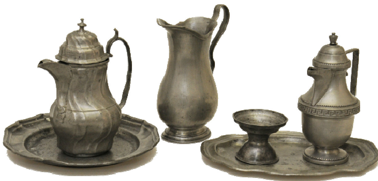
Obrázek 11- Cínové nádoby - konvice, talíře, slánka, počátek 19. století jedny ze sbírkových předmětů, které z výstavních důvodů v roce 2019 opustily depozitáře MGOH.