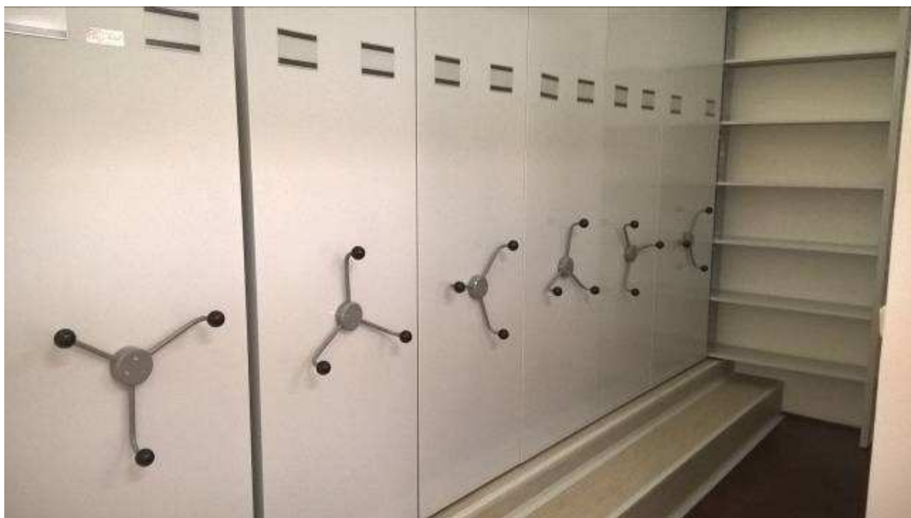
Obrázek 13 - Nový depozitář textilu

Dlouhodobou snahou MGOH je proto tyto depozitáře rekonstruovat a vybavovat v souladu s moderními muzejními trendy. V roce 2019 se i díky finančním prostředkům z fondu rozvoje a reprodukce podařilo nově vybavit depozitář textilu. Pro tyto účely byla nalezena prostorová rezerva v podobě skladu nepotřebného majetku. Místnost byla nově vybavena moderním regálovým systémem od společnosti Bláha s.r.o., která patří k předním českým výrobcům depozitářních systémů. Tato regálová sestava umožňuje plné využití prostoru a zároveň je přizpůsobená specifickým potřebám textilních sbírek. V následujících dvou letech proběhne přestěhování sbírky textilu do tohoto nového depozitáře, čímž se uvolní nové prostory pro celkovou rekonstrukci dalšího z depozitářů.