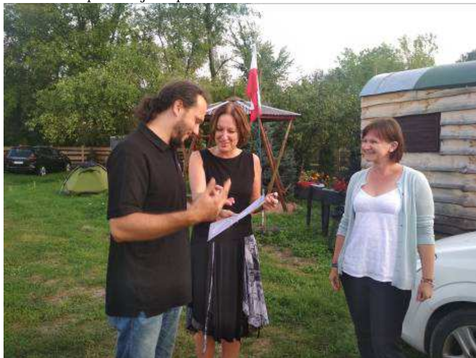
Obrázek 16 - Neformální setkání ředitele MGOH s vedením Muzea nadwiślańskie w Kazimierzu Dolnym na jejich archeologické základně v obci Żmijowiska v Polsku

výsledek těchto jednání byla v závěru roku 2019 uzavřena smlouva o spolupráci. Na jejím základě budou od roku 2020 probíhat oboustranné studijní výjezdy pracovníků a bude probíhat stínování v obou muzeích. Do budoucna je uvažováno o dalším prohlubování spolupráce za účelem realizace společných projektů.