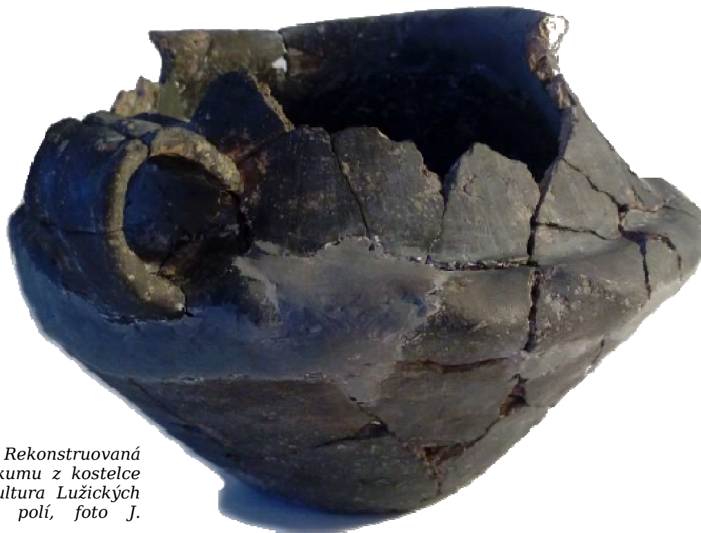
Obrázek 12 - Rekonstruovaná nádoba z výzkumu z kostelce nad Orlicí, Kultura Lužických popelnicových polí