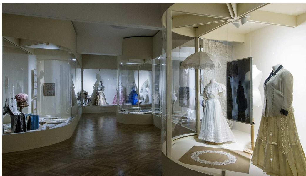
Obrázek 17 - Expozice Muzea krajky ve Vamberku

O tom, že se ke krajkářské tradici daří přitahovat širší pozornost svědčí i skutečnost, že Muzeum krajky ve Vamberku bylo v roce 2019 navštíveno na jaře ministrem kultury Antonínem Staňkem a v prvních dnech roku 2020 jeho nástupcem Lubomírem Zaorálkem.