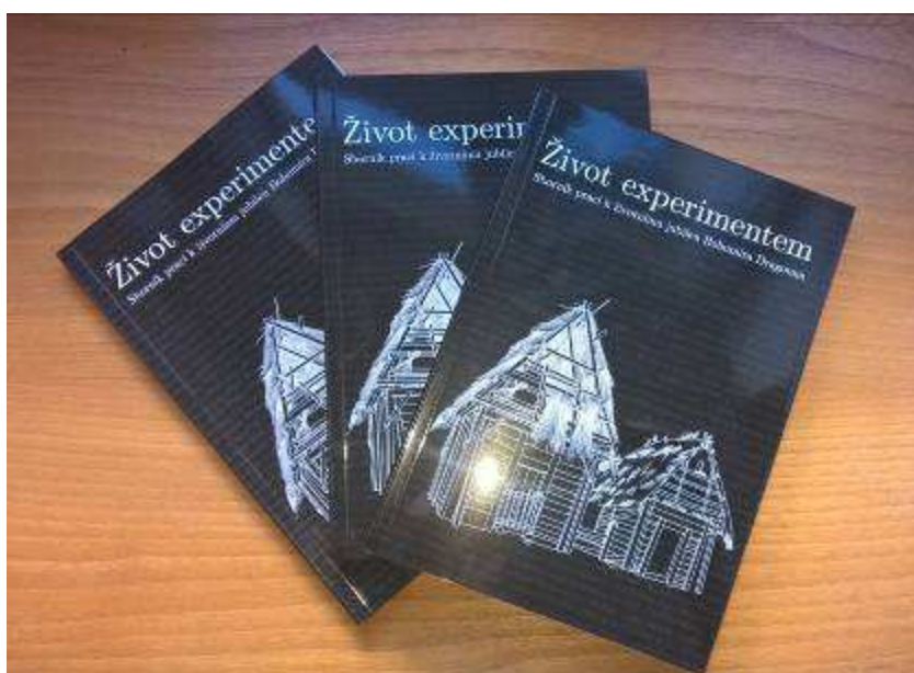
Obrázek 15 - Nový sborník Život experimentem vydaný Muzeem a galerií v Rychnově nad Kněžnou a Archeoparkem pravěku Všešary