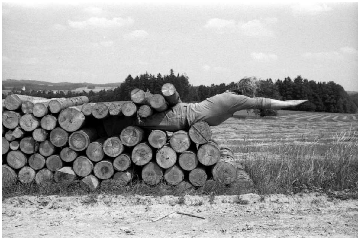
Obrázek 22 - Noc a den s králíkem a slepicí, 1979 (M. Langer, L. Plíva, M. Puk, Alena M., M. H. Forman) foto: Zdeněk Merta, Lhoty u Potštejna. Původní foto ve sbírce Uměleckoprůmyslového musea v Praze - Jedno z děl prezentovaných na výstavě Umění akce ve východních Čechách

Letní cyklus výstav otevřel 21. června 2019 Mgr. Aleš Veselý úvodním slovem k výstavě reprintů ze sbírky Österreichische Nationalbibliothek Wien Sídla našeho kraje na kresbách Jana Venuta (1746-1833). Expozice byla připravena ve spolupráci s ÖNB a Galerií výtvarného umění v Havlíčkově Brodě. Přinesla tímto způsobem výjimečnou příležitost