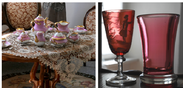
Obrázek 21 - Výstava "Prostřeno - tradice stolování od počátku 19. do 30. let 20. století"