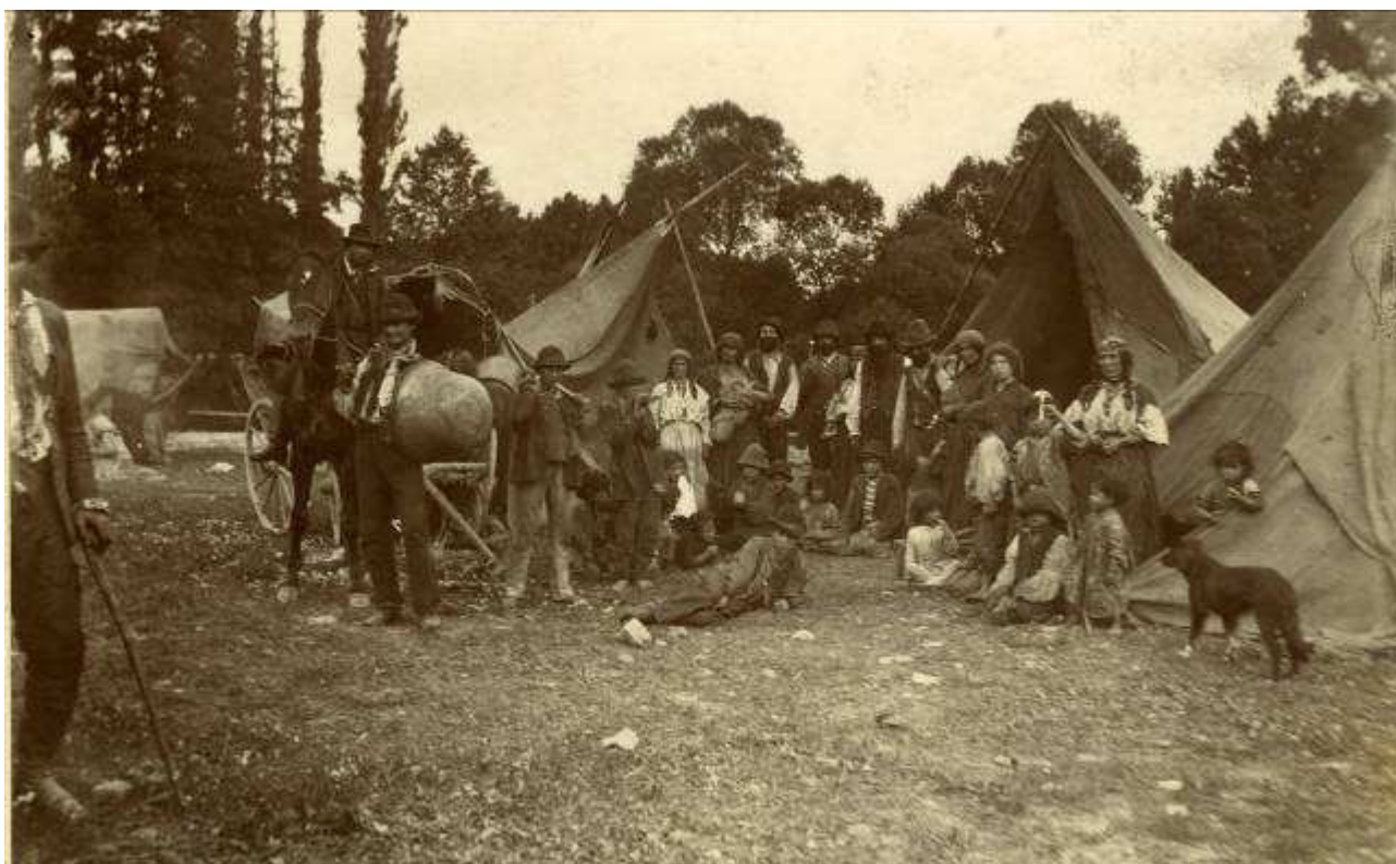
Obrázek 6 - jeden z digitalizovaných snímků ze sbírky Muzea a galerie Orlických hor v Rychnově nad Kněžnou zachycující cikánský tábor u Kostelce nad Orlicí na počátku 20. století

nosičů, které bylo oproti prvotním předpokladům výrazně větší. Následně proběhlo testování nevhodnější metody digitalizace záznamů. Jako nejefektivnější se nakonec ukázala varianta digitalizace prostřednictvím externího dodavatele. V roce 2019 se tak podařilo digitalizovat prvních deset VHS nosičů, jejichž obsah byl uložen na archivační DVD Tresor disky, jejichž předpokládaná životnost by se měla pohybovat v řádu desítek let. Digitalizace VHS kazet bude pokračovat i v následujících letech.