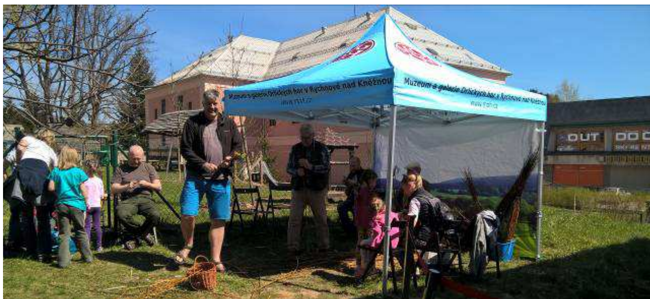
Obrázek 19 - Pletení pomlázek během akce Velikonoce v Sýpce se tradičně těší velké přízni návštěvníků

Novinkou roku 2019 byl v Sýpce vánoční program pro školy, který připravila muzejní pedagožka. V jeho rámci si děti s využitím sbírkových předmětů osvojovaly znalosti o Vánočních zvycích a obyčejích.