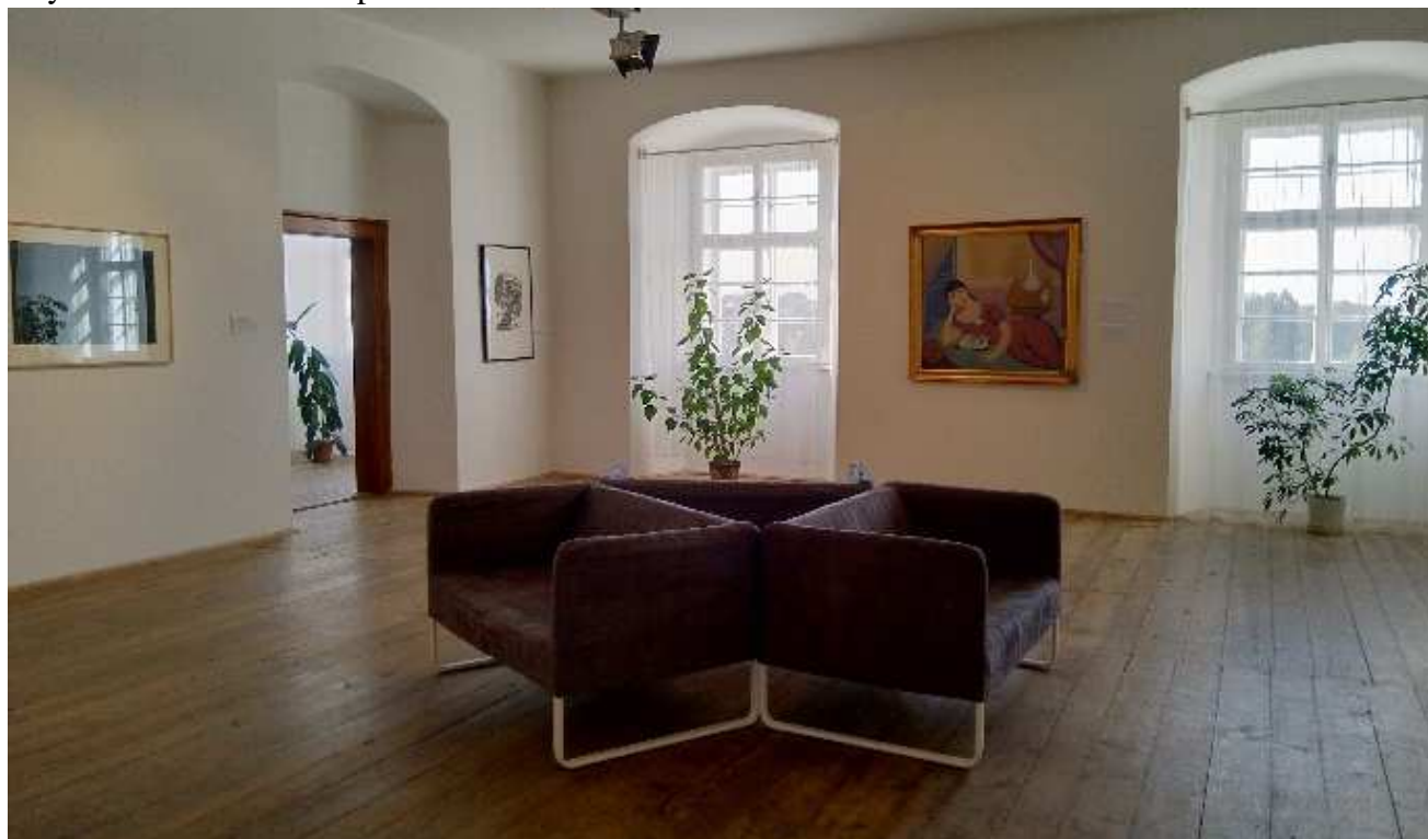
Obrázek 18 - Pohled do výstavy Orlický salon '19 - Osobní výběr v prostorách Orlické galerie.

Další činností vykonávanou na tomto pracovišti je také správa sbírkového fondu galerie. Průběžně byly zodpovídaný badatelské dotazy a na vyžádání též vyhotoveny odborné posudky a stanoviska. Vedoucí pracoviště zastává také post člena poradního sboru pro sbírkotvornou činnost Městského muzea v Ústí nad Orlicí. Mimo to působí v redakční radě sborníku Orlické hory a Podorlicko.