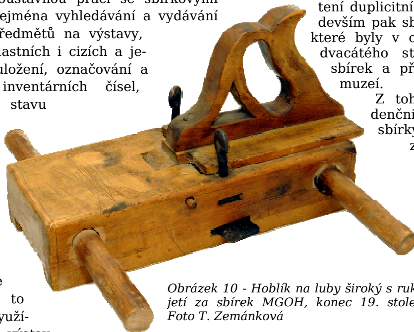
Obrázek 10 - Hoblík na luby široký s rukojetí za sbírek MGOH, konec 19. století.

Z toho důvodu se evidenční přírůstková čísla sbírky MGOH ve výroční zprávě z roku 2018 liší od údajů ze statistiky uváděné za rok 2019.