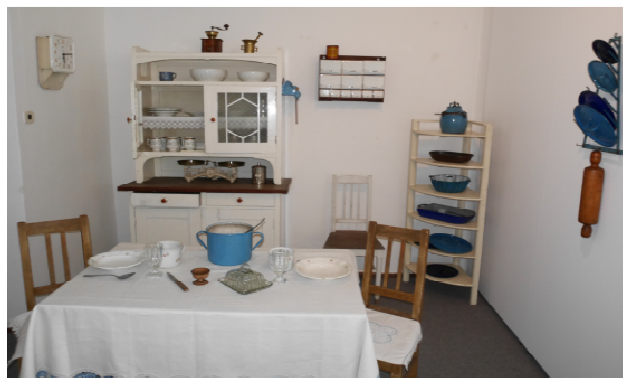
Obrázek 5 - Pohled do výstavy Prostřeno , jejíž příprava byla zajištěna zejména historickým a etnografickým pracovištěm

Kromě hlavní výstavy na rychnovském zámku, pracoviště připravovalo putovní výstavu k osobnosti Karla Poláčka. Dokončení této výstavy bylo z výše popsaných personálních důvodů posunuto na jaro 2020.