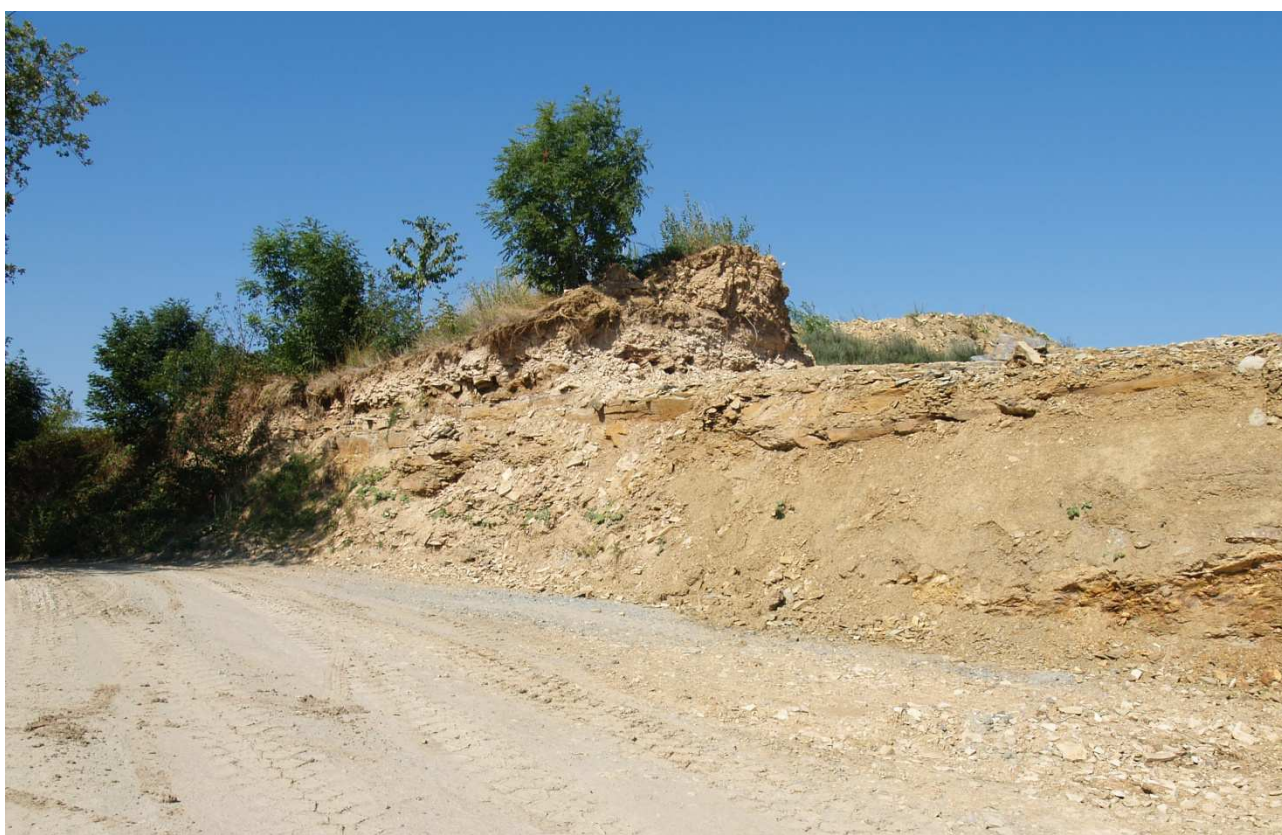
Obrázek 14 - Nadložní křídové sedimenty v zářezu u odvalu v Mastech.