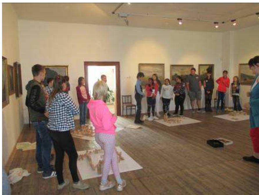
Obrázek 9 - Edukační program k výstavě Města, obce, a památná místa našeho kraje na kresbách Jana Antonína Venuta

a vývoje měst se zaměřením na region Rychnova nad Kněžnou. Kromě výkladu na děti