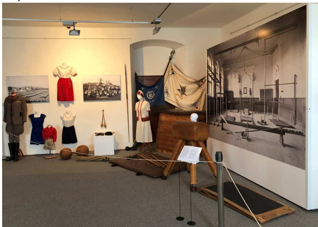
Obrázek 5 Pohled na výstavu "Ve zdravém těle zdravý duch"

Zároveň pracoviště zajišťovalo odbornou konzultaci pro badatelské dotazy a návštěvy a zajistilo možnost práce se sbírkovými předměty a materiály.