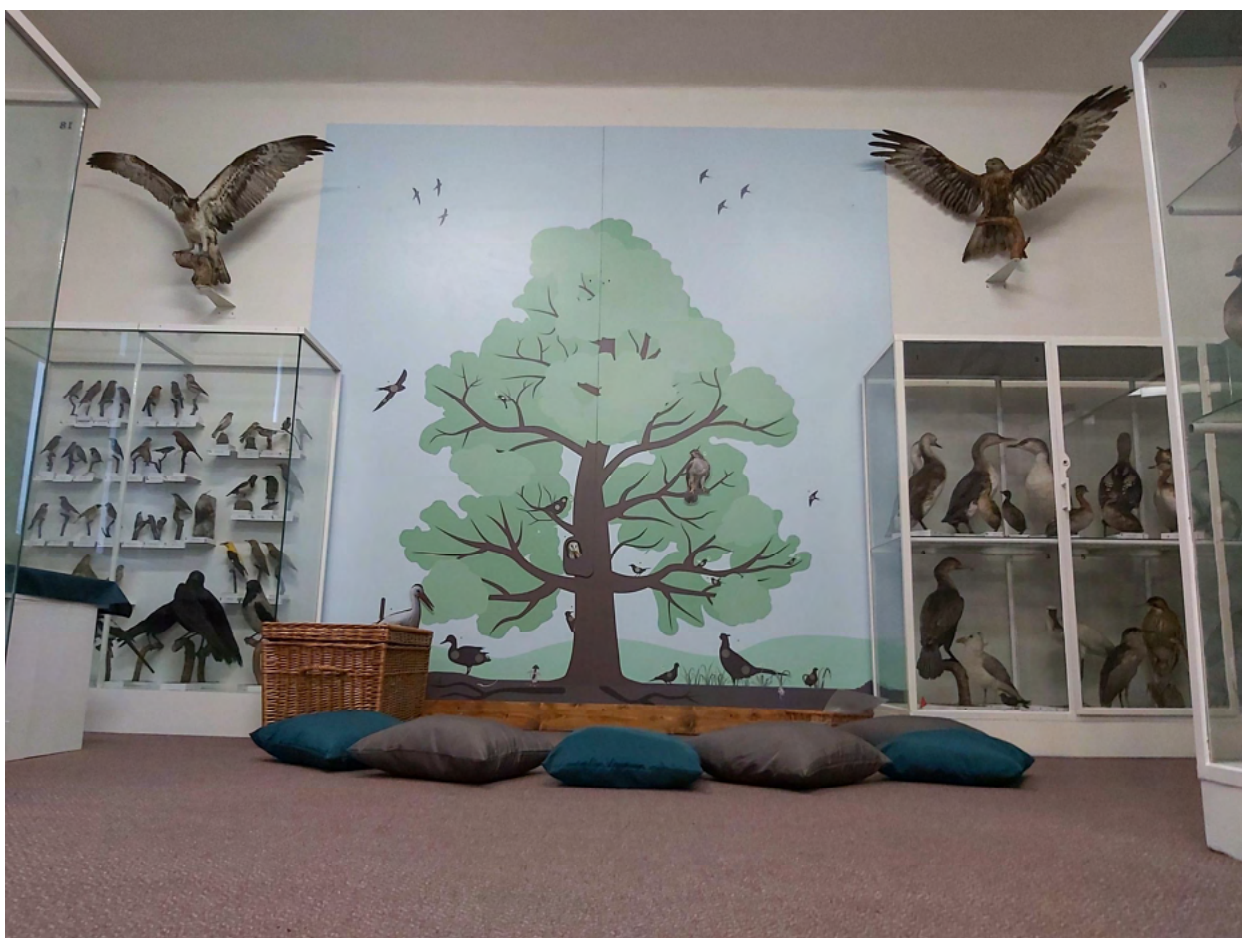
Obrázek 22 Jeden z nových edukačních prvků v Památníku Karla Plachetky