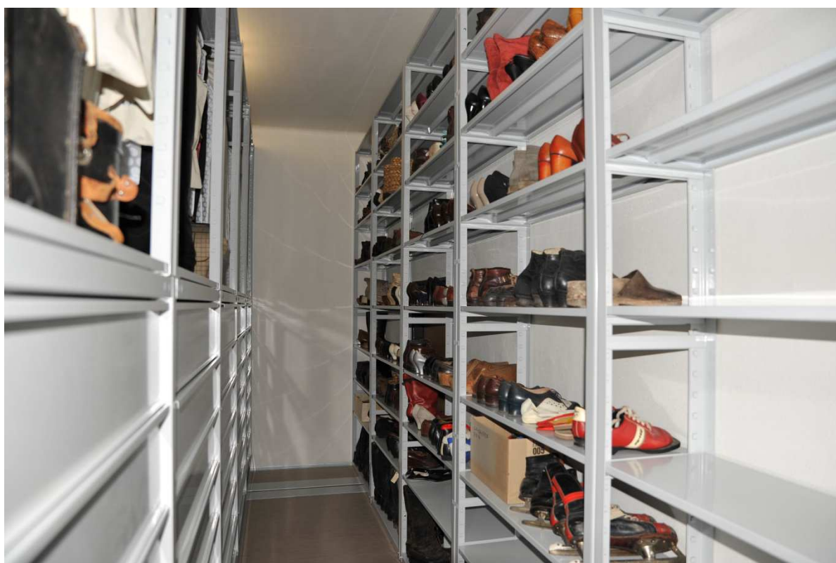
Obrázek 12 Ukládání historické obuvi v rámci nového depozitáře textilu.

vovaným investičním akcím v areálu nemocnice však musely být tyto prostory opuštěny. Díky jednání s Městem Rychnov nad Kněžnou se podařilo pronajmout nové depozitární prostory v budově bývalých kasáren v Rychnově nad Kněžnou, která je také sídlem MGOH. Do těchto prostor byla přestěhována celá sbírka plastik (část sbírky byla deponována v také v rámci rychnovského zámku). Díky tomu byla odstraněna určitá roztržitost této sbírky, která komplikovala péči i využívání sbírky. Zároveň došlo k uvolnění prostor v Orlické galerii, které mohou být nově využity k výstavním účelům.