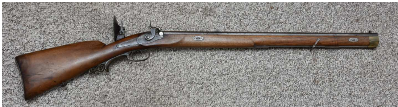
Obrázek 10 Jedna z akvizic muzea v roce 2020 historická puška z produkce Rychnovského puškaře F. Pátka

Základní péče o sbírky je mimo konzervaci zajišťována pracovištěm správy sbírek. Převážná část agendy tohoto pracoviště je tvořena soustavnou prací se sbírkovými předměty - zejména vyhledávání a vydávání sbírkových předmětů na výstavy, do expozic