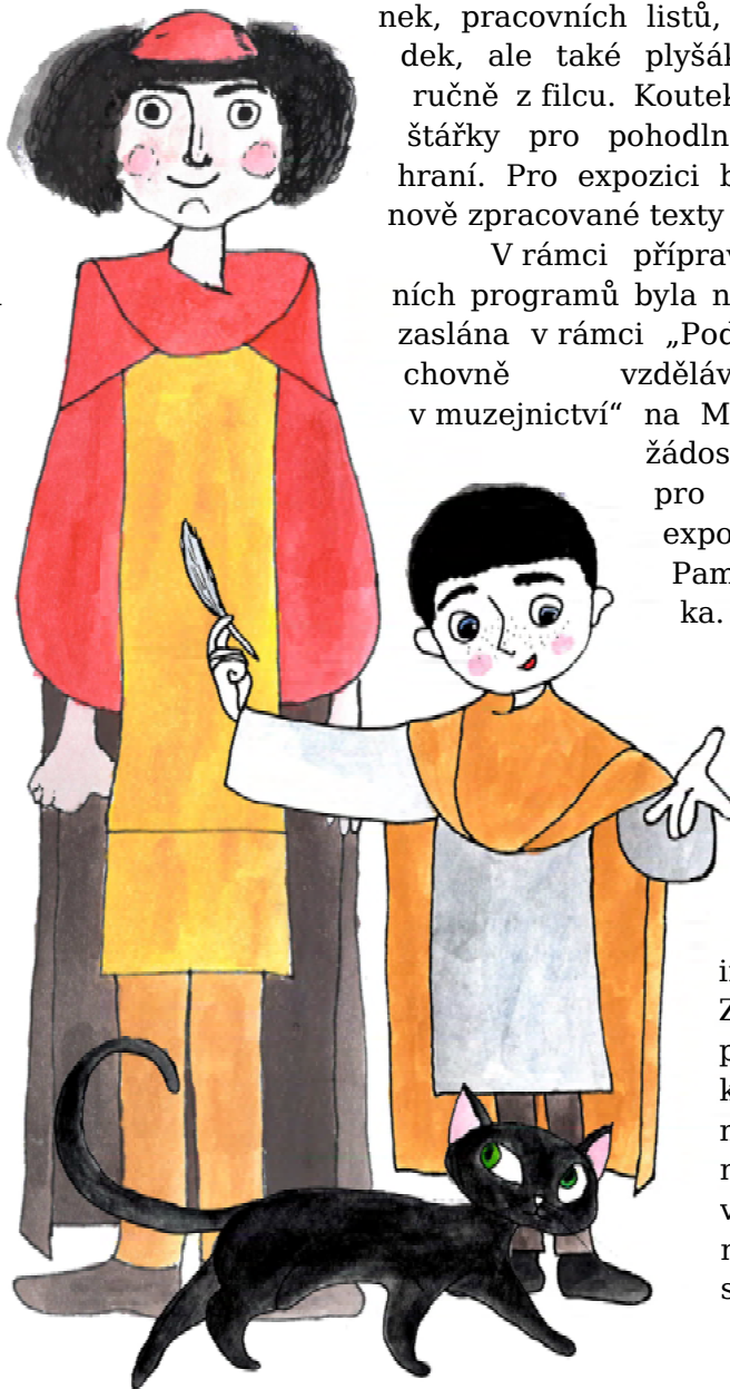
Obrázek 9 Kosmas, Bertík a Zelenoočko - průvodci edukačním programem v opočenské expozici

V roce 2020 pokračovalo pracoviště pravidelným vytvářením a zasláním tiskových zpráv, ale i drobnějších informací, médiím. Zasílané byly také pravidelně pozvánky na různé muzejní akce. Pracoviště nadále pokračuje ve správě oficiálních webových stránek muzea.