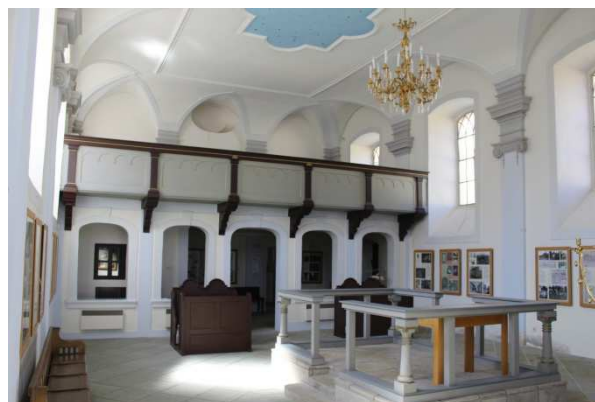
Obrázek 21 Synagoga v Rychnově nad Kněžnou

V současné době je provoz této expozice smluvně zajišťován Městem Rychnov nad Kněžnou a pracovníky místního IC.