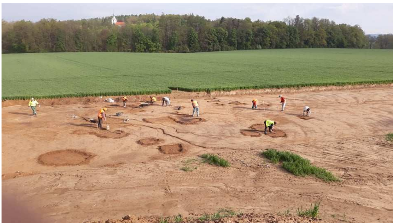
Obrázek 1 Archeologický výzkum obchvatu Domašína

Mezi drobnějšími výzkumy je třeba vyjmenovat část pravěkého sídliště v jižním záboru cihelny Kostelec nad Orlicí , pokračování vrcholně středověkých situací při dobrušské poliklinice (stavba výtahu), prů-