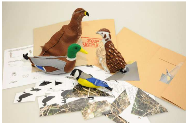
Obrázek 8 Edukační materiál k programu "Tajní ptačí agenti"

hnízdem. Díky dotaci Ministerstva kultury bylo možné, mimo dalších pomůcek, nakoupení několik desítek plyšových ptáčků s reálnými hlasy. Děti tak ptáčka mohou vidět, slyšet, ale také pohladit si, což je u této věkové kategorie velice důležité. Zapomenout se nesmí ani na dřevěného Kika. Ten během řízené relaxace pomáhá dětem navodit v myšlenkách pocit létání. Na závěr děti čeká podle věkové skupiny buď připravená spojovačka / omalovánka čápa černého nebo pracovní list pro zopakování získaných informací. V případě zájmu je možné si prodloužit lekci o výrobu dalekohledu z ruliček od toaletního papíru. Druhá část programu byla určena pro žáky 4. a 5. tříd základních škol, se kterými je možné probrat téma již podrobněji. Kromě mnohých informací ze světa ptáků čeká na žáky také hra „Tajní agenti“, během které