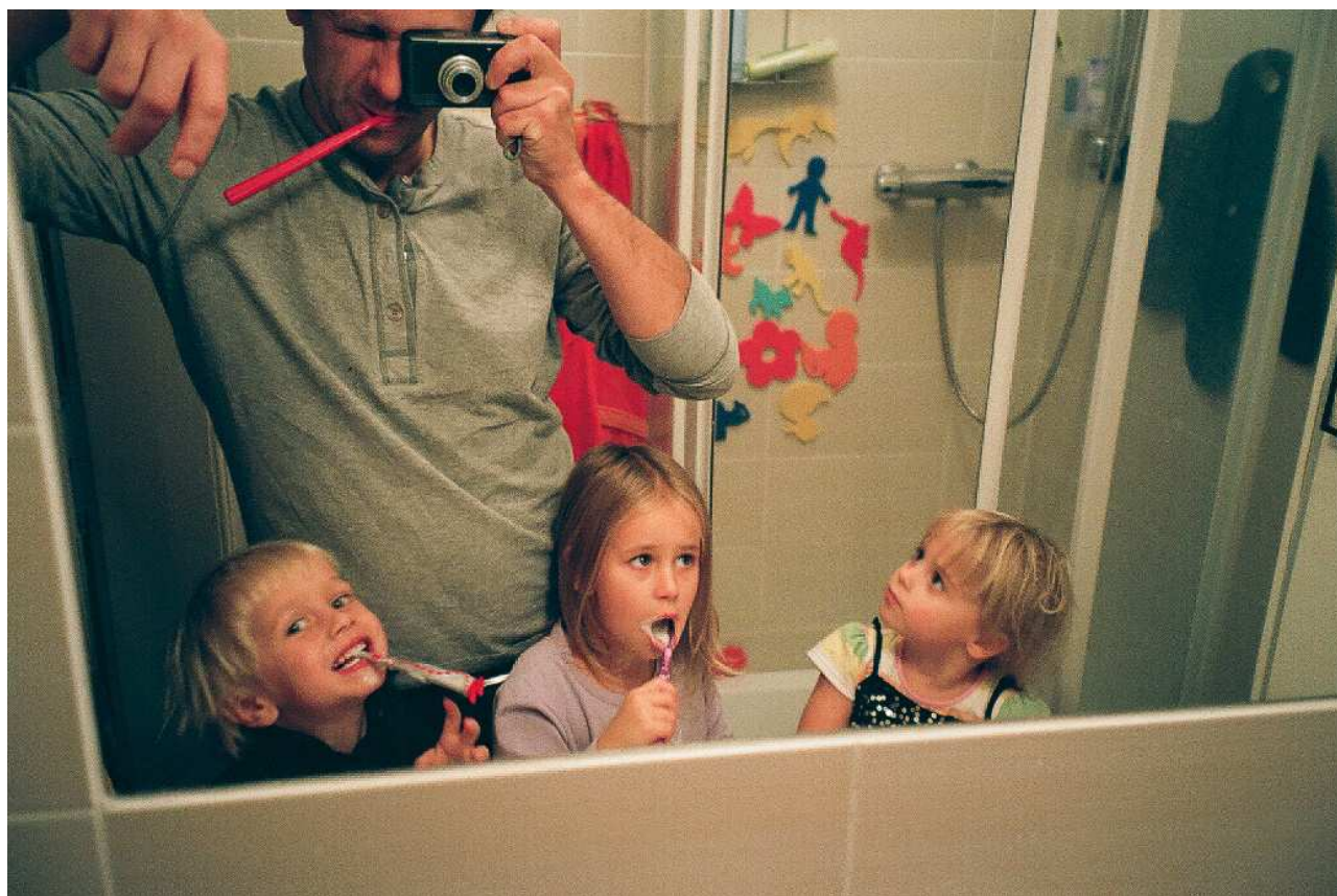
Obrázek 19 Fotografie z výstavy Igor Chmela: Sirkoň , uspořádané v roce 2020 v Orlické galerii

Koncem roku vznikla ideová a praktická příprava na vybudování multifunkčního veřejnosti přístupného prostoru - knihovna, badatelna a prostor pro odborná a veřejná setkávání (debaty, kulaté stoly, přednášky, setkání s teoretiky, historiky, edukátory, pedagogy a umělci, autorská čtení nebo např. koncerty pro jedno dílo). Tato prostora, jejíž realizace je plánována na rok 2021 bude volně navazovat a doplňovat nově vybudovanou Galerii za zdí.