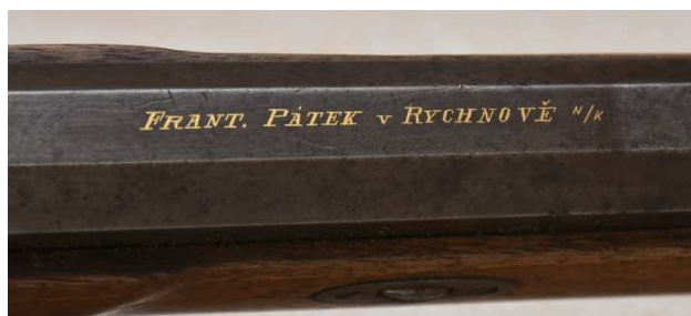
Obrázek 11 Detail signatury pušky porízené do sbírky muzea v roce 2020

vychází z odborné profilace muzea a je realizována cílevědomým a systematickým shromažďováním předmětů muzejní povahy, jež jsou nositeli svědectví o minulých stavech či dějích.