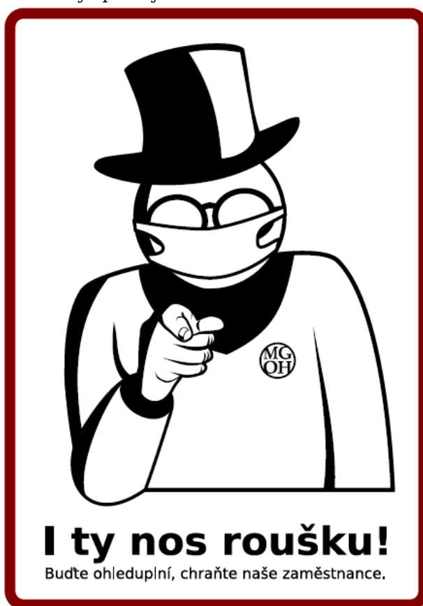
Obrázek 27 Plakát vyzývající návštěvníky k nošení roušek vytvořený v duchu jednotné vizuální koncepce muzea

vě nad Kněžnou a Hradci Králové jako poděkování a vyjádření podpory jejich práce. V oblasti plnění pracovních úkolů se některým zaměstnancům "uvolnily ruce" pro řešení dlouhodobějších úkolů, kterým v minulých letech z důvodu jiných činností nemohlo být věnováno dostatek pozornosti. Díky tomu se například podařilo zdigitalizovat výrazně větší množství papírových inventárních karet.