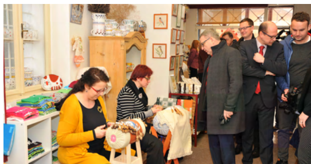
Obrázek 17 Návštěva ministra kultury Lubomíra Zaorálka v Muzeu krajky Vamberk

Cílem muzea je propagovat a především udržet kulturní tradici Vamberecké krajky. V roce 2019 se k tomuto úsilí podařilo významně přispět zápisem Tradice krajkářství na Vamberecku na Seznam nemateriálních statků tradiční lidové kultury České republiky. V této souvislosti navštívil Muzeum krajky ve Vambereku v prvních dnech roku také ministr kultury ČR Lubomír Zaorálek.