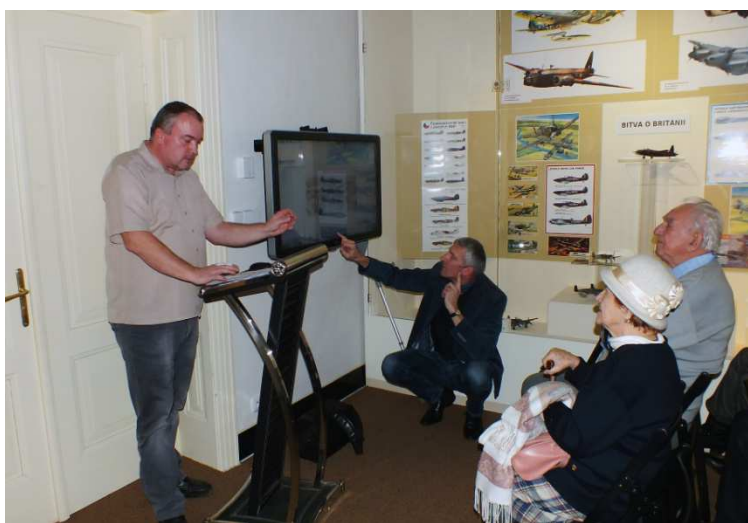
Obrázek 16 Představení výstavy Čechoslováci v boji za vlast uspořádané ve spolupráci se Spolkem přátel historie Vamberka

ného semináře (viz Semináře a konference). Úzká spolupráce pokračovala v roce 2020 i se Spolkem přátel historie Vamberka. V rámci této spolupráce byla uspořádána výstava Čechoslováci v boji za vlast, vytvořena putovní výstava Orlické hory na Fotografiích Jiřího Šulce a další projekty.