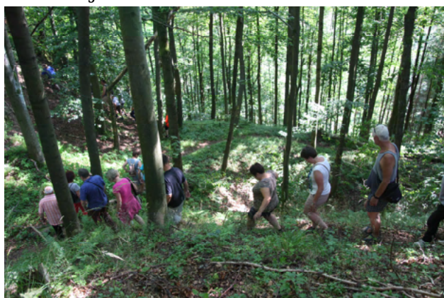
Obrázek 25 Archeologické léto - exkurze na hrad Klečkov