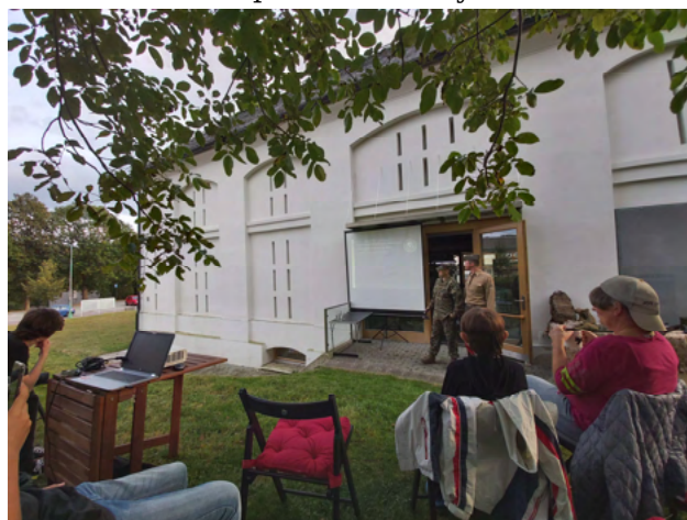
Obrázek 20 Přednáška Námořní pěchota USA, organizovaná pracovníky expozice Sýpka, se v rámci protiepidemických opatření konala pod širým nebem.