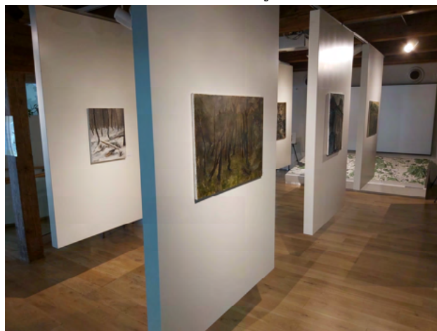
Obrázek 24 Výstava Paměť Orlických hor