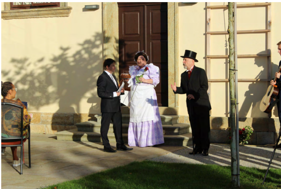
Obrázek 26 Vernisáž letních výstav

Popis: Tradiční zahájení letní výstavní sezóny. Vzhledem k platným protiepidemickým opatřením se v roce 2020 tato vernisáž konala pod širým nebem v prostoru sala terreny Kolowratského zámku v Rychnově nad Kněžnou. Pro návštěvníky byl připraven hudební kulturní program spojený s představením výstav letního cyklu Orlické galerie.