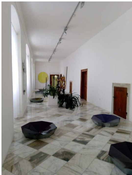
Obrázek 23 Výstava Břetislav Malý: Sjednucující pocit

Malíř a výtvarník, který se zabývá významem a vztahem barev nejen vůči sobě samým, médiu obrazu nebo objektu, ale i divákovi. Instalace objektů, jejichž barevnost se proměňuje nejen vzhledem ke světlu, ale i pozorovateli, který je mójí, bude jistě působivým zpestřením pro milovníky umění.