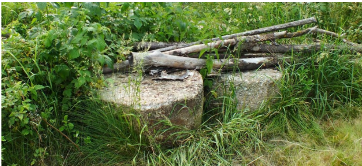
Obrázek 2 Mlýnské kameny dokumentované na Vamberecku

V roce 2020 byla ve spolupráci se znalci místní topografie provedena terénní dokumentace pozůstatků výroby mlýnských