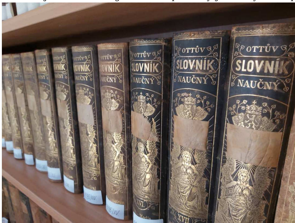
Obrázek 6 Detail literatury uložené v rámci knihovny MGOH

V období 1.1. 2020 až 31.12. 2020 bylo zcatalogizováno nebo recatalogizováno 1475 knihovních jednotek, přičemž průběžně probíhala i oprava již zpracovaných záznamů (překlepy, doplnění třídníků MDT (meziná-