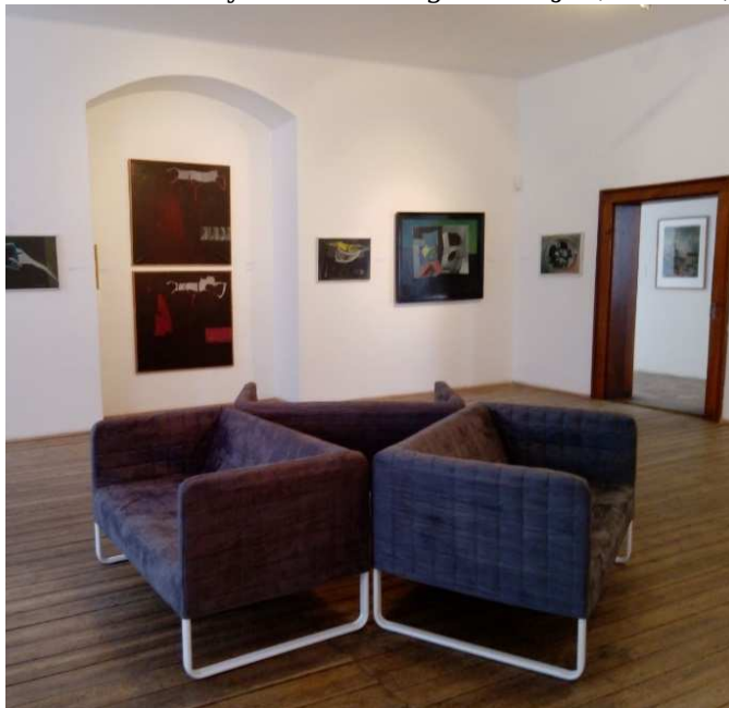
Obrázek 18 Pohled do výstavy František Doležal / Poesie a život uspořádané v roce 2020 Orlickou galerií

Z kraje roku (březen, duben) vzhledem k epidemiologickým opatřením prezentovala sbírkovou činnost Orlické galerie na svém facebookovém profilu: Orlická galerie, kde publikovala medailonky a práce výtvarných umělců, kteří jsou zastoupeni v její