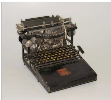
Psací stroj Caligraf ze sbírek MGOH.

Správkyňe muzejní sbírky předkládala sbírkové předměty ke studiu badatelům dle pokynů ředitele a dbala na dodržování badatelského řádu.