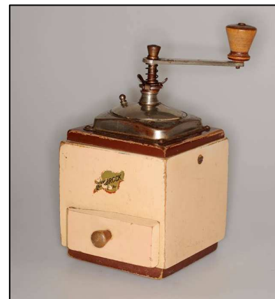
Mlýnek na kávu z roku 1930.

Celkem bylo zkontrolováno 169 sbírkových předmětů.