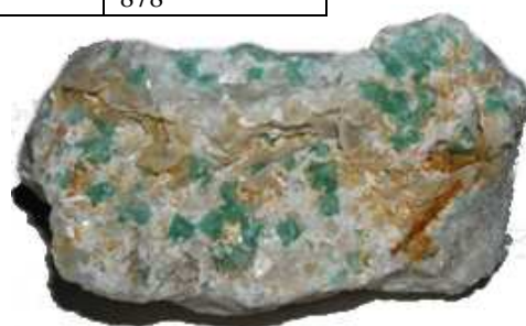
Fluorit, kalcit a laumontit, minerály – Litice nad Orlicí. Ze sbírek MGOH.