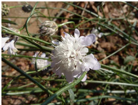
Hlavatka sedmihradská ( Cephalaria transylvanica ) nově zavlečený druh v květeně České republiky.