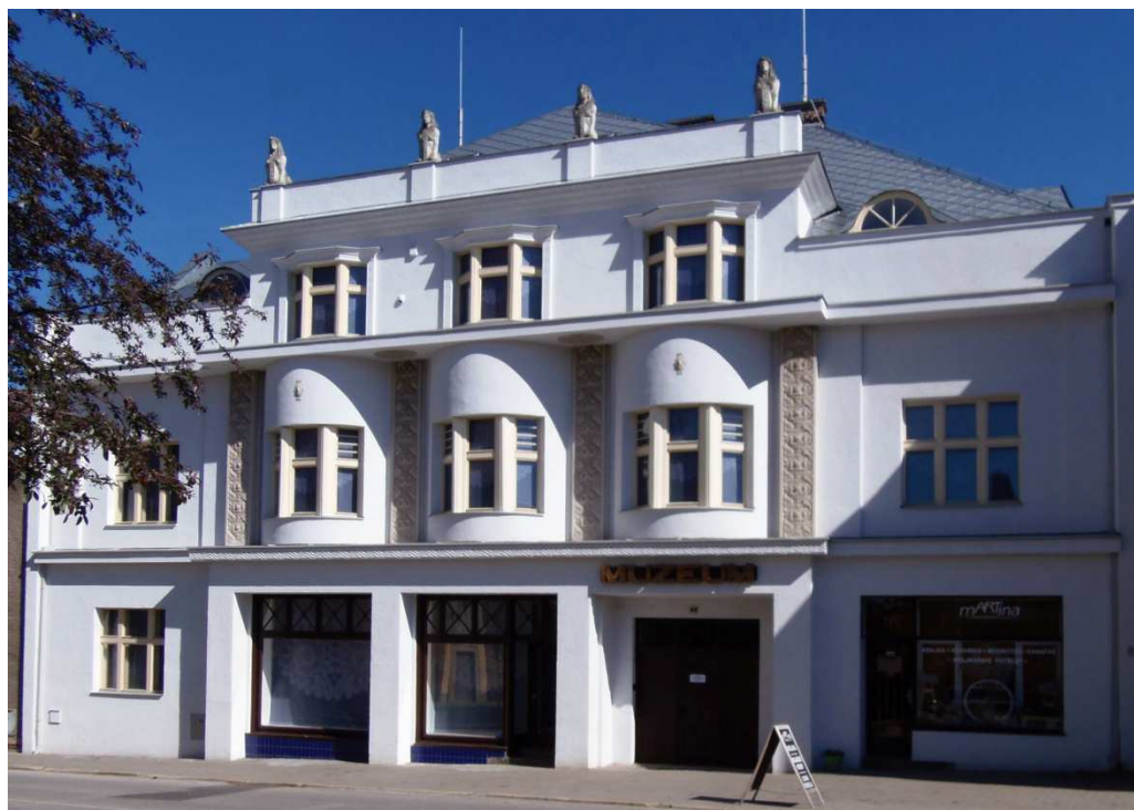
Nově zrekonstruovaná budova Muzea krajky Vamberk.

Návštěvnost MKV v roce 2016 činila 5433 evidovaných návštěvníků.