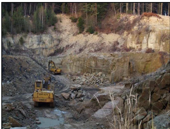
Sršňův, dříve Cabalkův lom.

Výzkumy na poli historie byly soustředěny převážně na poznání hospodářských dějin regionu v 19. a první pol. 20. století. V roce 2016 byly