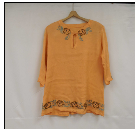
Halenka oranžová s korálky, 70. léta 20. století. Ze sbírek MGOH.

Celkem bylo vyfotografováno 282 sbírkových předmětů.