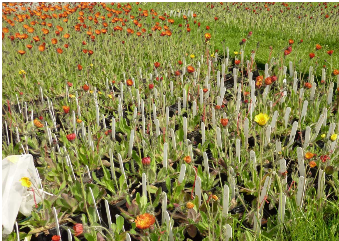
Pohled do pokusné zahrady se záhonem pěstovaných rostlin.

informace o rozšíření celkem 192 taxonů vyšších cévnatých rostlin. Ve většině z nich jsou obsaženy i údaje z průzkumů botanika Jana Doležala.