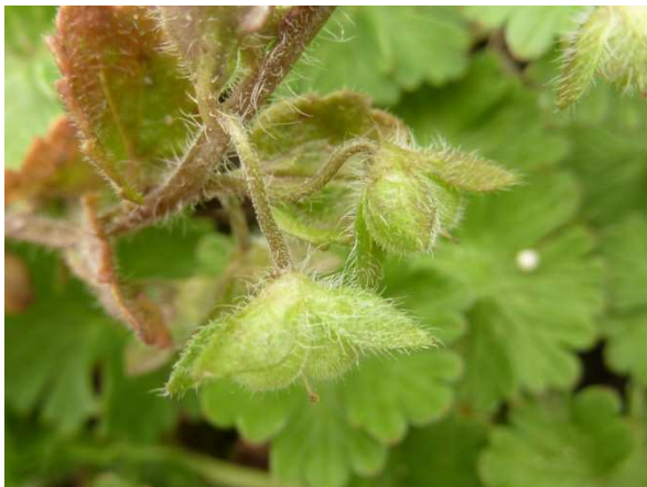
Rozrazil matný ( Veronica opaca ) na lokalitě u Týniště nad Orlicí.

V oblasti lichenologie byl zejména prováděn terénní výzkum lišejníku v přírodní rezervaci Sedloňovský vrch. V rámci tohoto výzkumu byl prováděn i sběr vzorků s následnou determinací, inventarizací a zařazením nových položek do muzejního herbáře. Výstupem tohoto výzkumu se staly nejen vlastní nové herbářové položky, ale i odborná studie. Krom nových vzorků probíhalo i odborné zpracování starších dosud nezařazených vzorků.