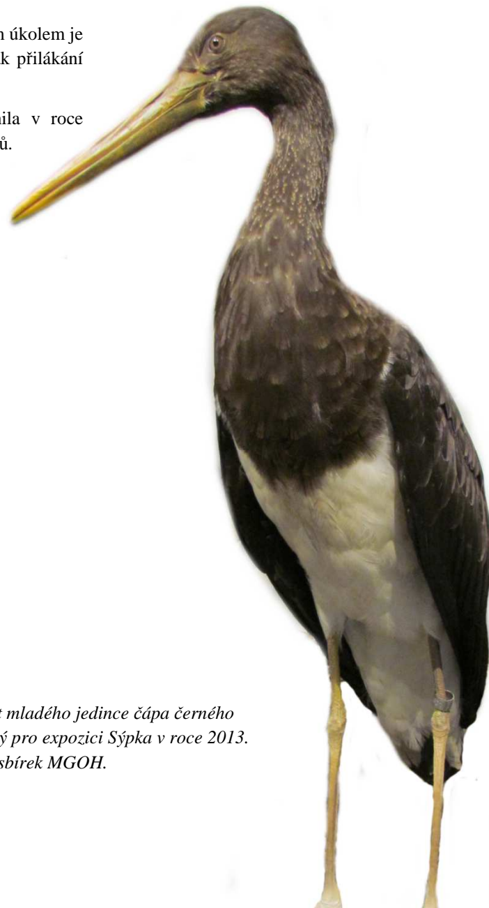
Preparát mladého jedince čápa černého vytvořený pro expozici Sýpka v roce 2013. Součást sbírek MGOH.

Návštěvnost expozice Sýpka činila v roce 2016 celkem 6666 evidovaných návštěvníků.