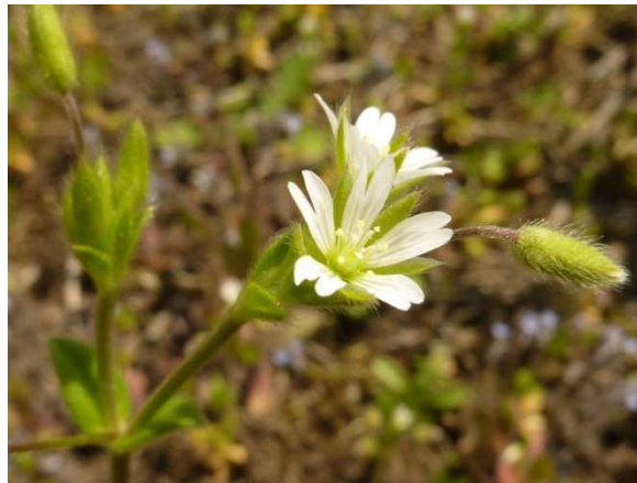
Rožec Tenoreův ( Cerastium tenoreanum ) na lokalitě u Očelic.

Fytosociologická studie lesů terasového území v dolních částech povodí Orlice a Loučné. [2831 floristických záznamů]).