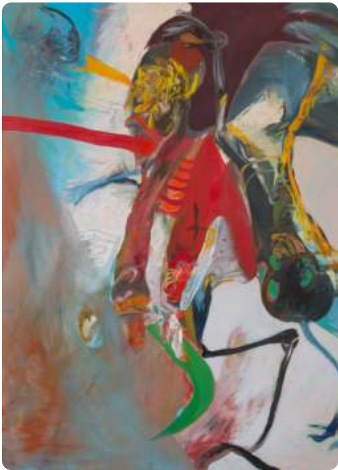
Jaroslav Horálek: Baroko (1991).