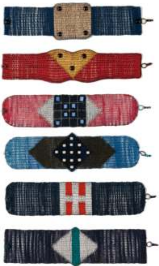
Jaroslav Prášil: náramky (2017).