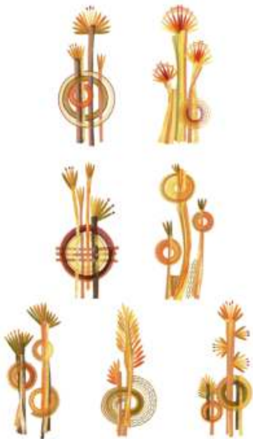
Ivana Domjanová: Kruhy (2012).