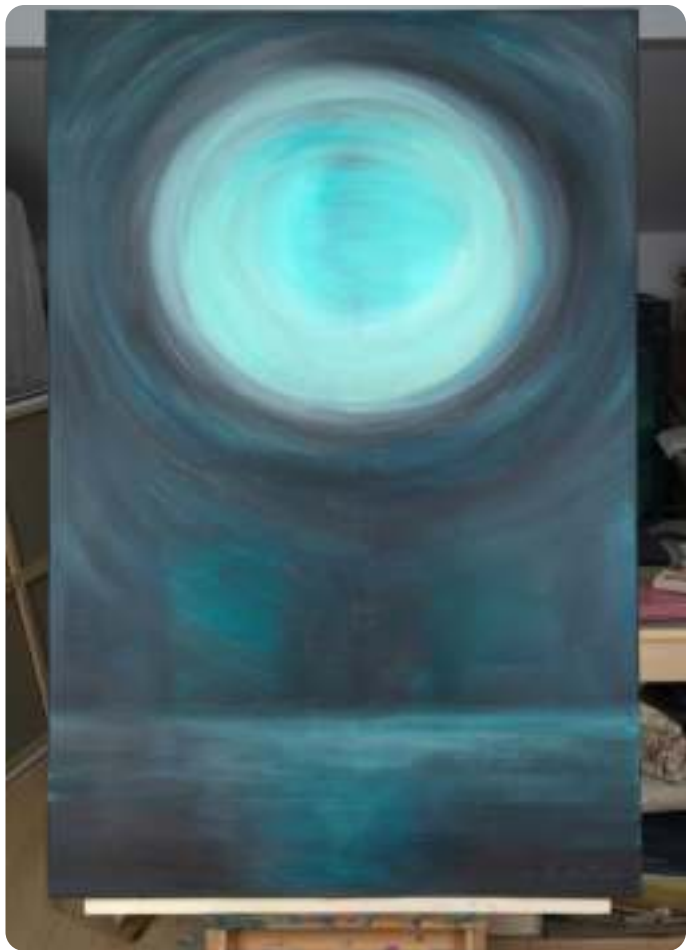
Jitka Štenclová: Úplněk (2017).