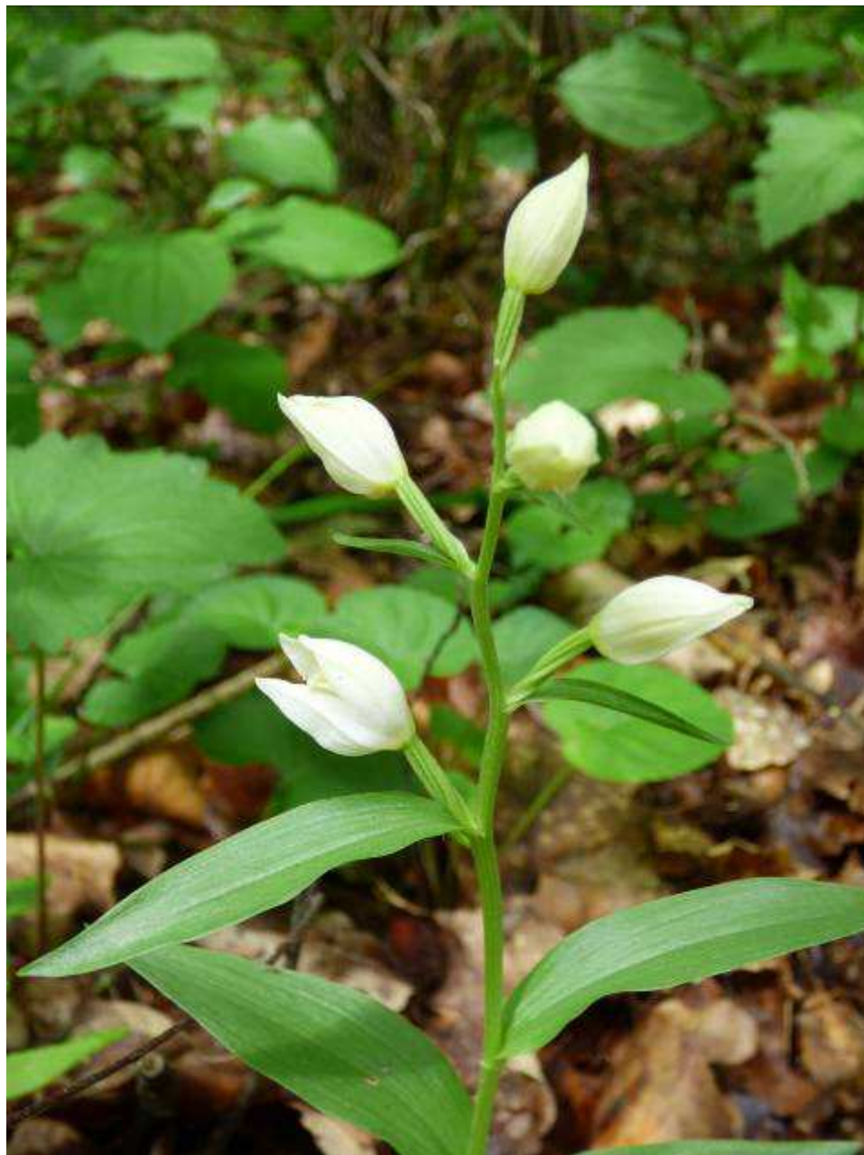
Obrázek 4- Okrotice bílá ( Cephalanthera damasonium) na nově objevené lokalitě u Olešnice nedaleko Častolovic (29. 5. 2019)