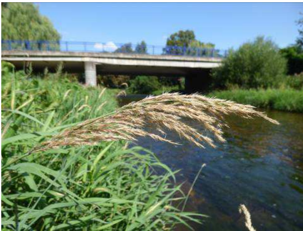
Obrázek 3 - Velmi vzácná trtina pobřežní ( Calamagrostis pseudophragmites) na břehu Divoké Orlice u Kostelce nad Orlicí, kde byla natáčena jedna z reportáží pro Český Rozhlas (2. 8. 2019).

V roce 2019 nadále probíhala účast na několika projektech, z nejvýznamnějších jmenujme projekt „Květena východních Čech“, „PLADIAS - Rozšíření cévnatých rostlin v ČR“