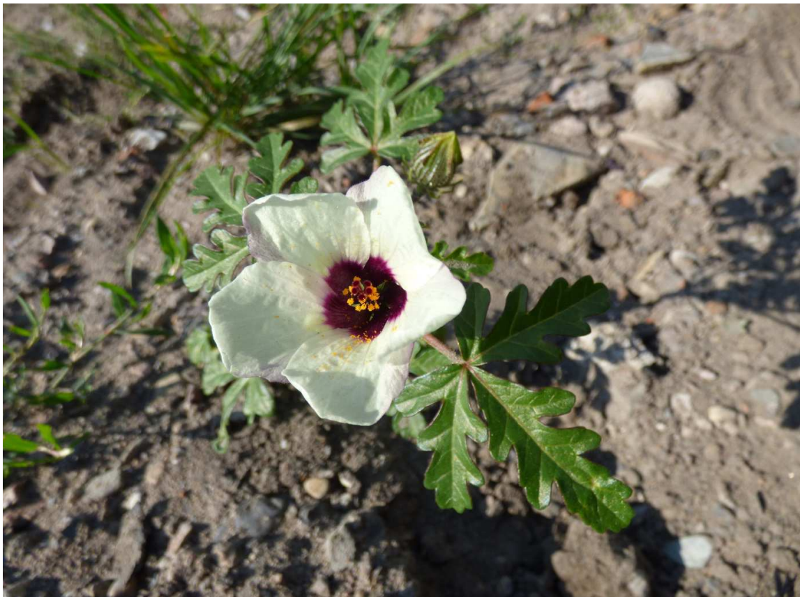
Obrázek 4 Kriticky ohrožený ibišek trojdílný ( Hibiscus trionum) na nově objevené lokalitě u Lípy nad Orlicí (15. 7. 2020)

odborných konzultací a posudků. V drtivé většině případů se jedná o pomoc s určováním rostlin na základě fotografií či herbářových položek. Mimo to byly také poskytnuty konzultace k vhodnému managementu na lokalitách s výskytem ohrožených druhů rostlin.