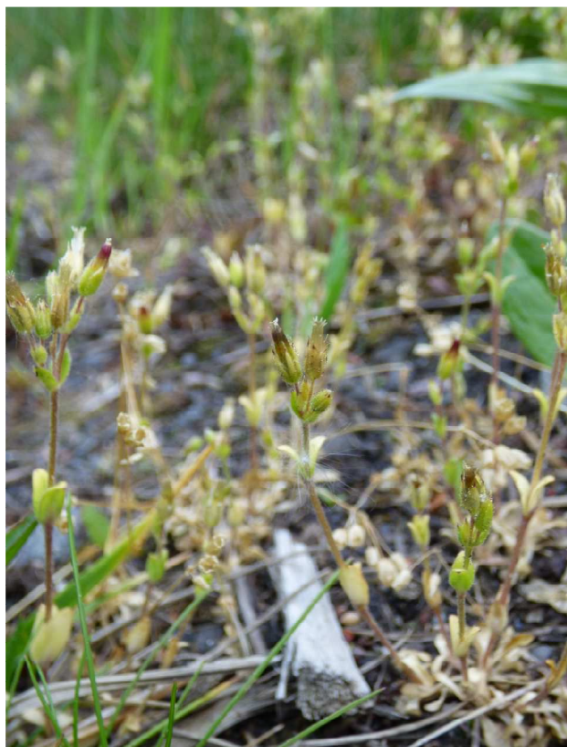
Obrázek 3 Nově se šířící slanomilný druh rožec čtyřmužný ( Cerastium subtetrandrum, 27. 4. 2020)

ných článků zabývajících se současným rozšířením chlupáčků ve východních Čechách. V současné době jsou publikovány tři články zaměřené na rod chlupáček z území Dolního Poorličí, Orlických opuk a Orlického podhůří, a také z Broumova. Všechny dosud vyšlé články byly publikovány ve Zprávách České botanické společnosti.